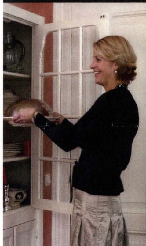
Servies van haar schoonmoeder dat nog steeds wordt aangevuld met oude en nieuwe stukken.

'Het is verbazingwekkend hoe snel je in je rol als moeder groeit'