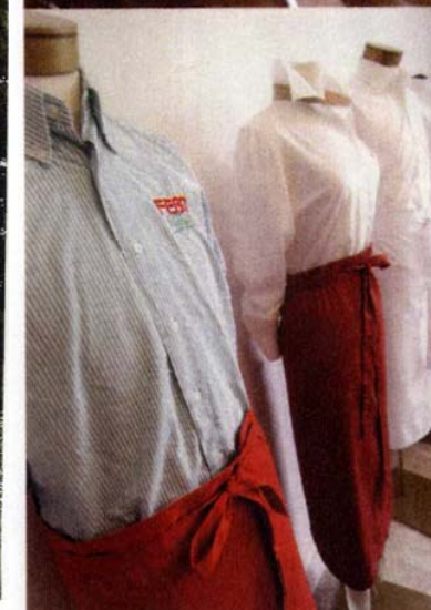
Enkele voorbeelden van bedrijfskleding.