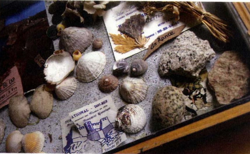
Een kistje met Franse vakantieherinneringen.