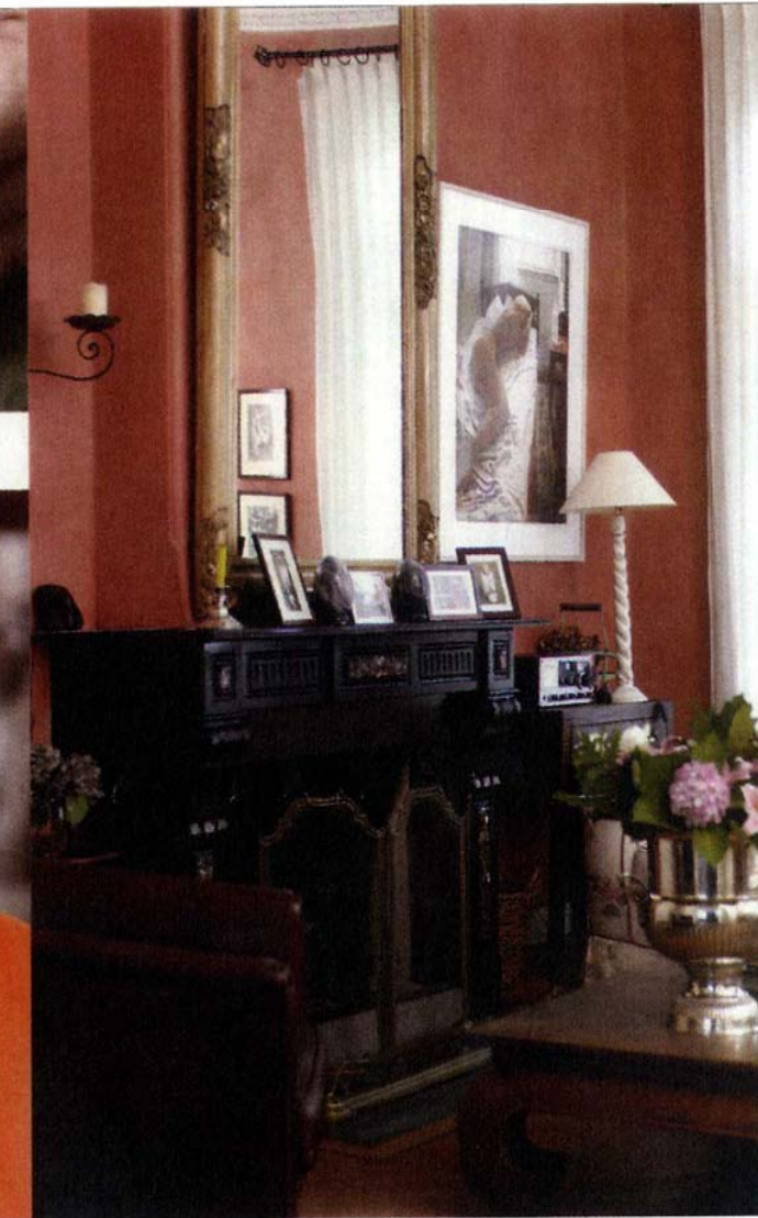
De spiegel, gevonden in Brussel, bleek precies te passen boven de schouw.