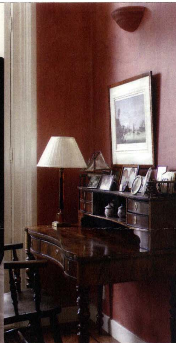
Dressoir in de woonkamer, de kleur van de muren komt uit Venetië, de verf is in Nederland gemengd.

weggetje. Het was een zalige tijd, maar na krap twee jaar begon het bij mij toch weer te kriebelen. Toen ben ik bij McGregor begonnen. Ik reisde in het begin op en neer tussen België en Nederland. Maar uiteindelijk was dat niet vol te houden, dus zijn we weer in Nederland neergestreken. Ons huis in Baarn is heerlijk, we hebben er inmiddels het nodige aan verbouwd. Een nieuwbouwhuis was voor ons geen optie."