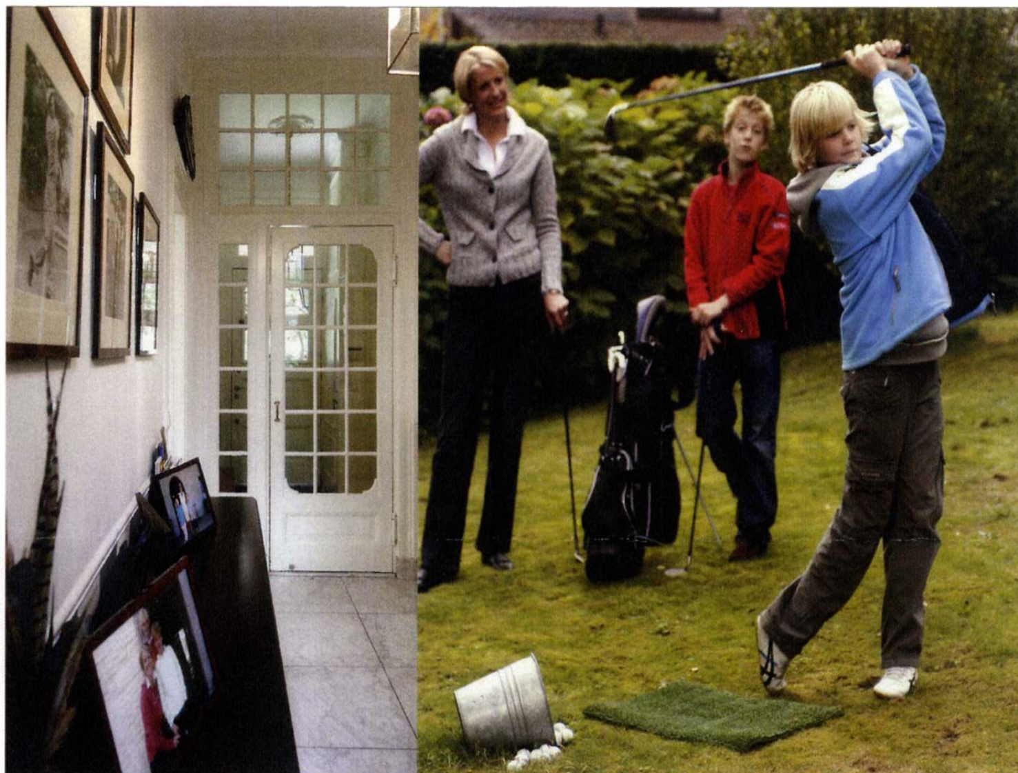
De hal van het huis, met originele details. Het pand is ondertussen een monument.