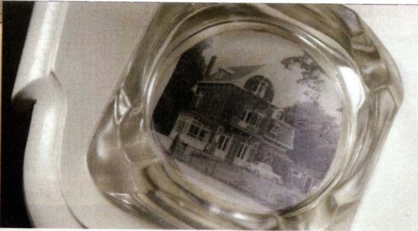
Van de vorige eigenaar kregen ze deze asbak met daarin een foto van het huis.