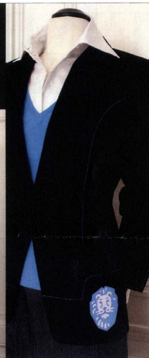
Kleding voor de medewerkers van de Postbank-winkel in Nijmegen.